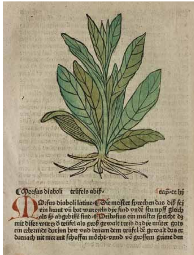
Изображение Morsus diaboli в «Gart der gesuntheit» (Augsburg: [Johann Schönsperger], 1485).

Шестая помощь от нея такова. Которои человек отросли съест, ино того человека отнюдь одышка не имеет, хотя верьсту бежит, не задышится.